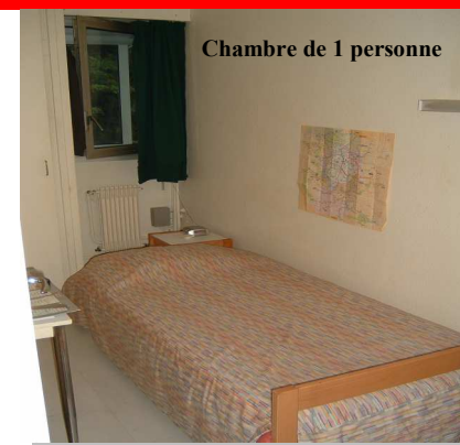
Chambre de 1 personne

6 chambres de 2 personnes de 18 m 2 dont 4 avec douche individuelle