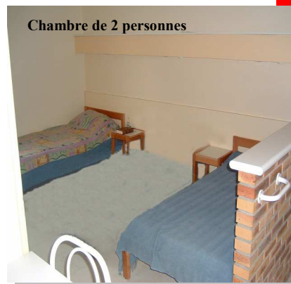
Chambre de 2 personnes

6 chambres de 2 personnes de 18 m 2 dont 4 avec douche individuelle