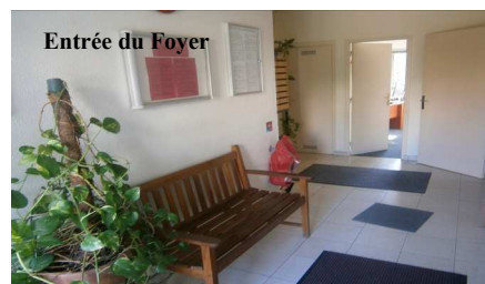
Entrée du Foyer